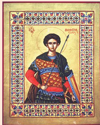
Άγιος Δημήτριος ο Μυροβλήτης St. Demetrios the Myrrh-streamer