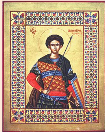
Άγιος Δημήτριος ο Μυροβλήτης St. Demetrios the Myrrh-streamer