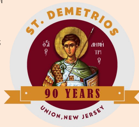
Άγιος Δημήτριος ο Μυροβλήτης St. Demetrios the Myrrh-streamer